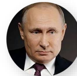
В.В. Путин Президент РФ

“ ...У нас в атомной промышленности мы реально работаем очень хорошо. Мы реально обогнали всех, мы больше всех делаем в мире атомных блоков для электростанций, это никакое не оружие, это высокие технологии... ”